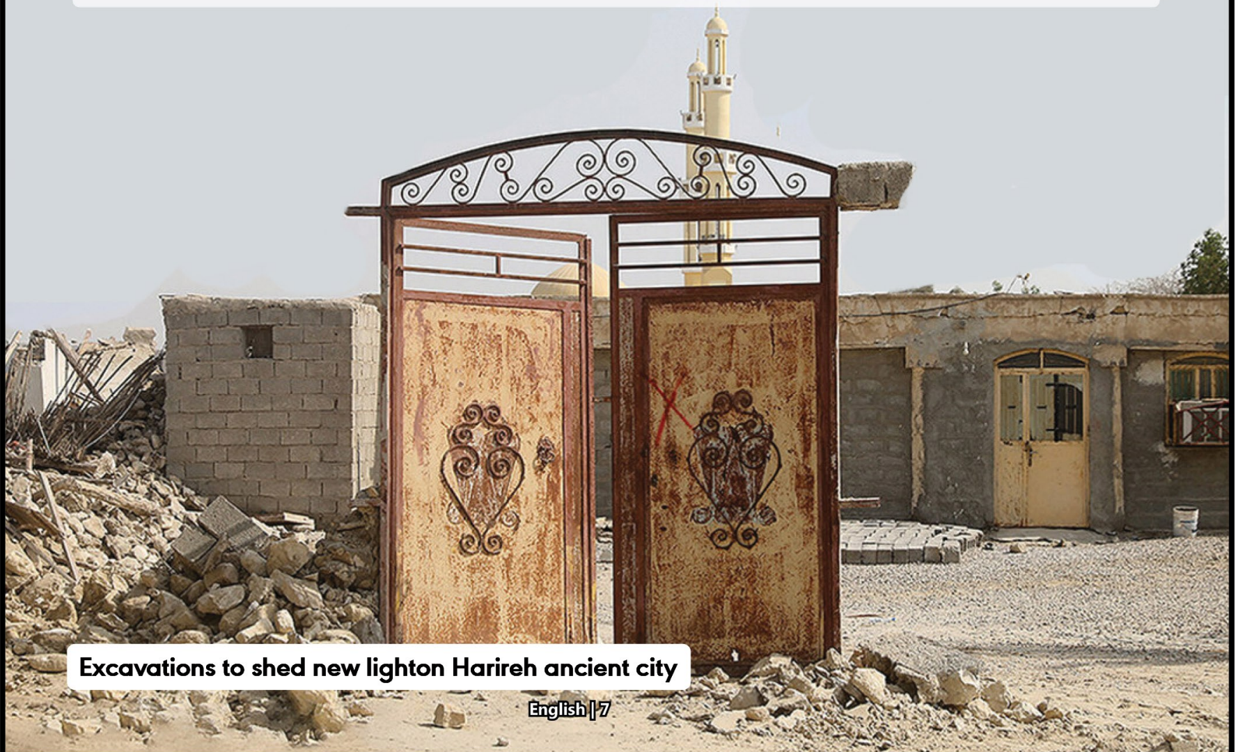
Excavations to shed new light on Harireh ancient city