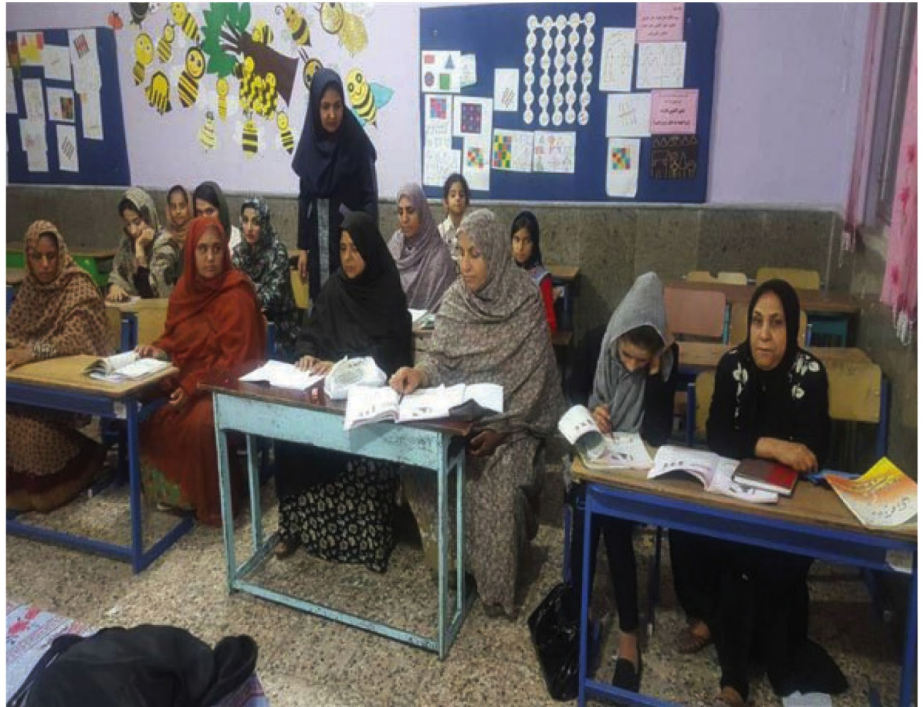
معاون سوادآموزی استان هرمزگان در گفت و گو با دلفین خبر داد:

وی ضمن ارائه توضیحاتی در خصوص روند اصلاح قانون مبارزه با مواد مخدر، اذعان کرد: در حال حاضر نحوه انجام تحقیقات مقدماتی در جهت ضربه به بنیان مالی قاچاقچیان مواد مخدر و جلوگیری از نقض احکام صادره از اهمیت ویژه ای برخوردار است. جمادی یادآور شد: لازم است با همکاری ضابطان قضایی در این خصوص تدابیر لازم اندیشیده شود.