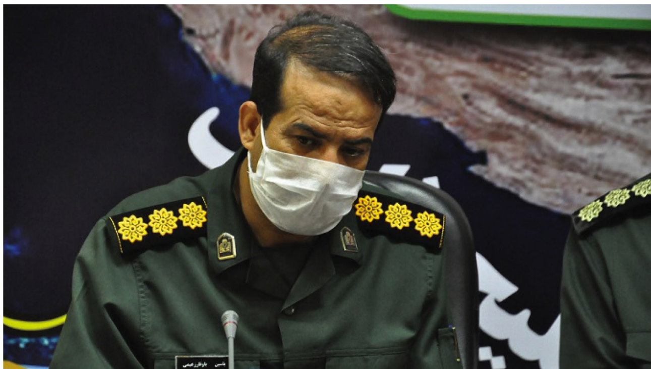
رئیس سازمان بسیج سازندگی هرمزگان در گفت‌وگو با دلفین اعلام کرد؛

وی افزود: ضروری است که بومیان و اهالی مناطق در صورت تجاوز افراد سودجو به حریم یا بستر رودخانه‌ها مسئولان مربوطه را از چنین اقداماتی آگاه سازند تا از بروز خسارت‌های بعدی جلوگیری شود.