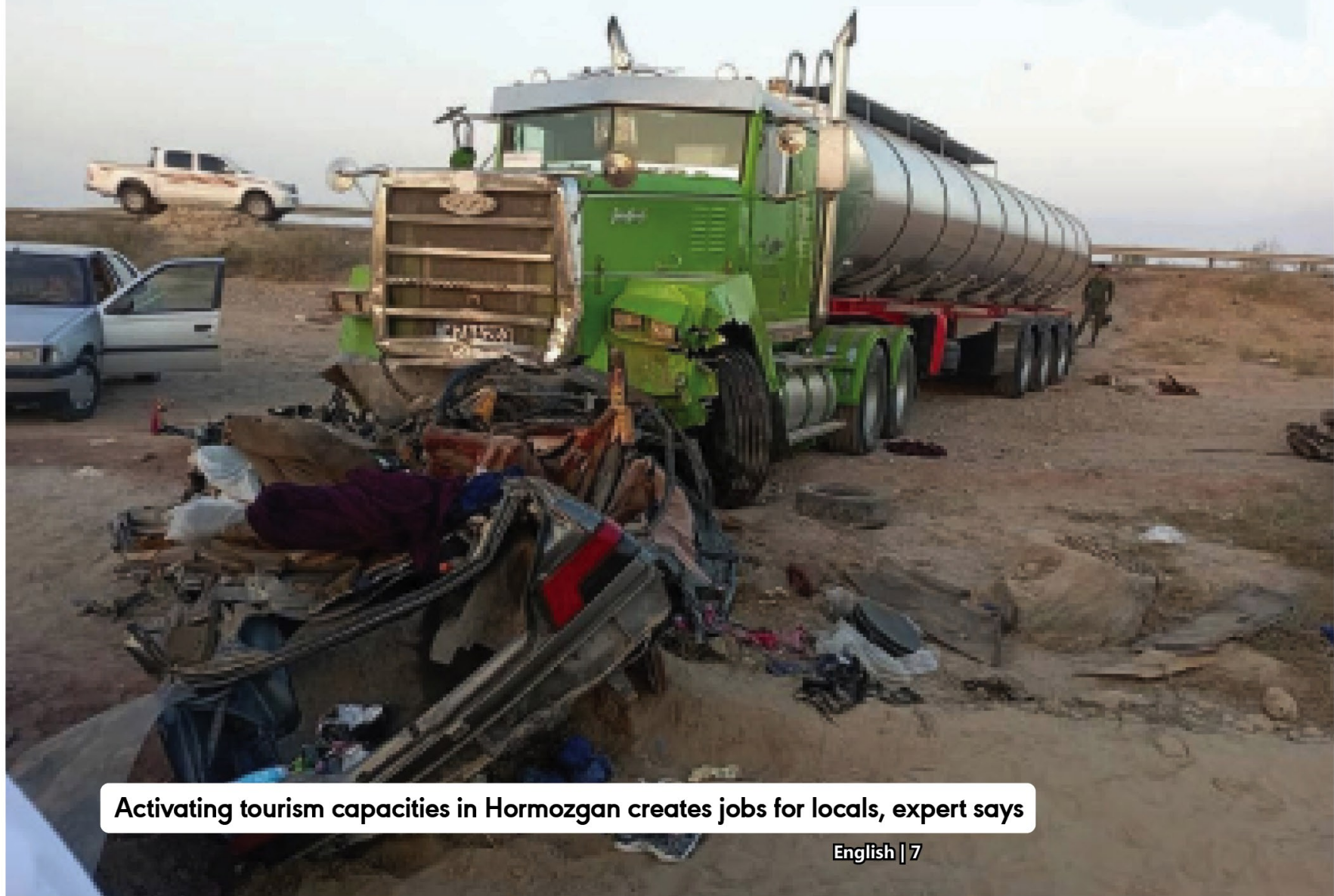
Activating tourism capacities in Hormozgan creates jobs for locals, expert says